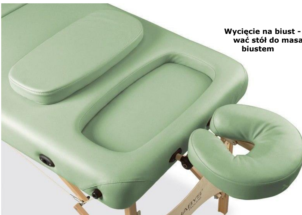
Wycięcie na biust - pozwala przystosować stół do masażu kobiet z dużym biustem