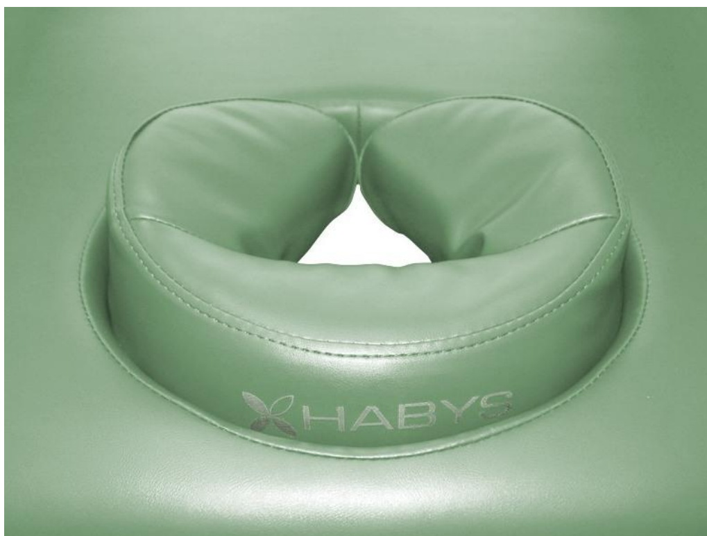
Wycięcie na twarz Komfort - komfortowe uzupełnienie lub alternatywa dla podglówka