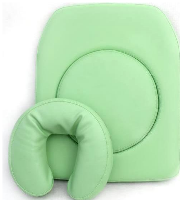
Okrągłe wycięcie w zagłówku z miękką poduszką i zatyczką