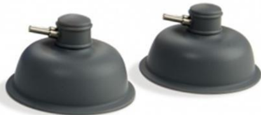
Ssawka Ø 60 mm do Avaco