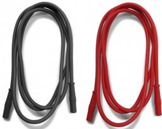
Przewody podciśnieniowe - czarny, czerwony