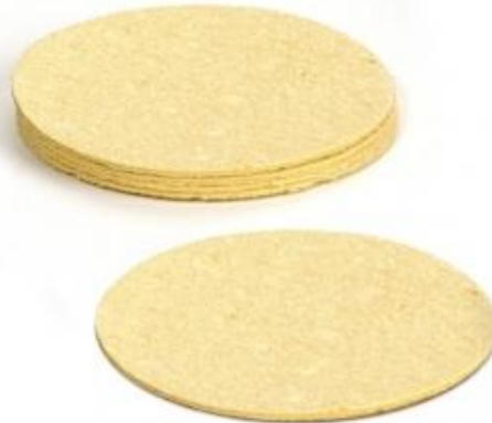
Wkładka wiskozowa Ø 90 mm