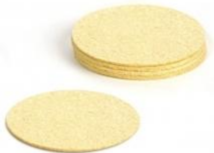
Wkładka wiskozowa Ø 60 mm