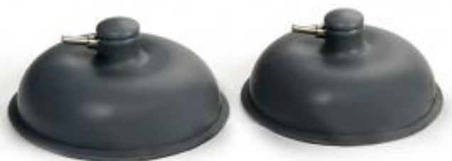
Ssawka Ø 90 mm do Avaco