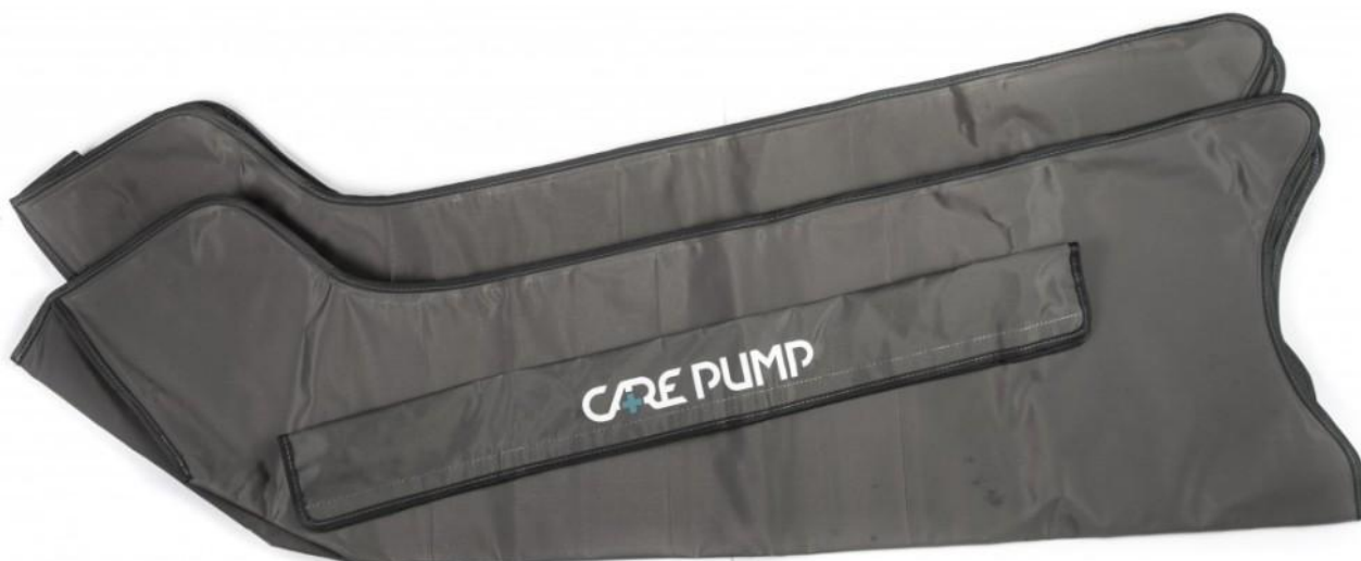
Mankiety na nogi (komplet 2 szt.) 4-komorowe