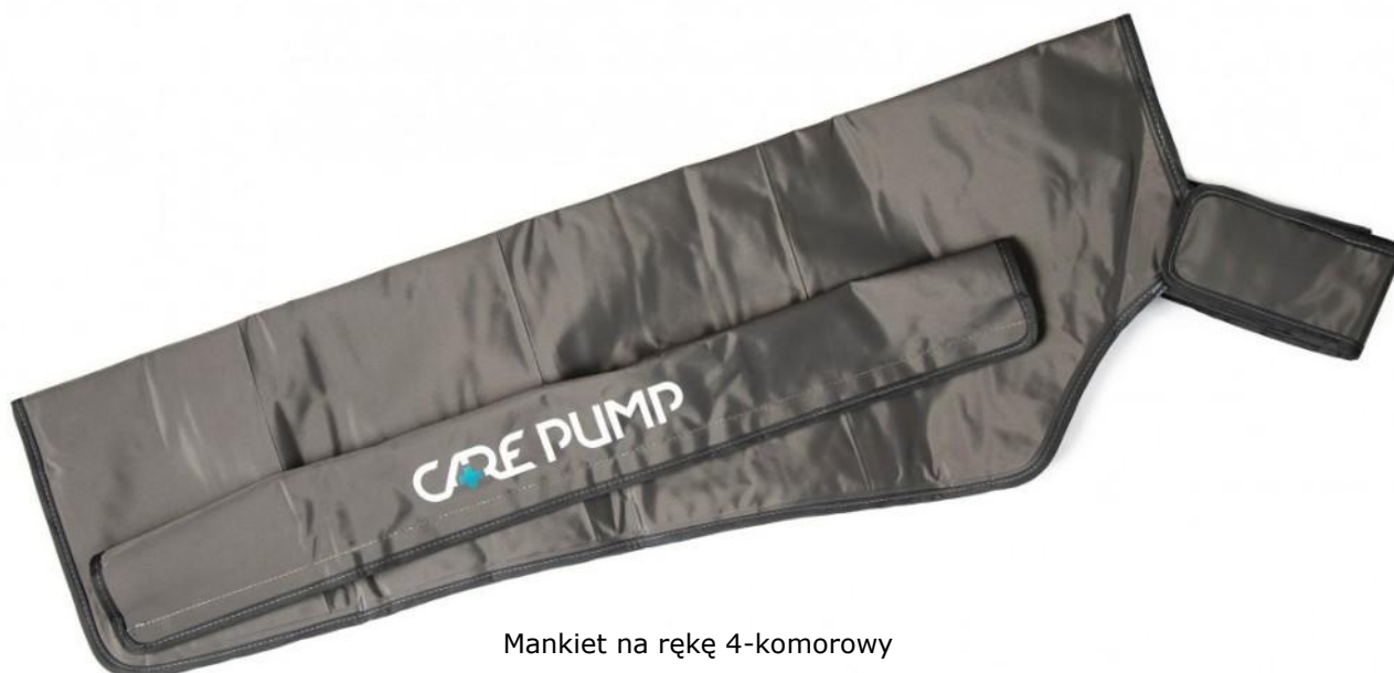
Mankiet na rękę 4-komorowy