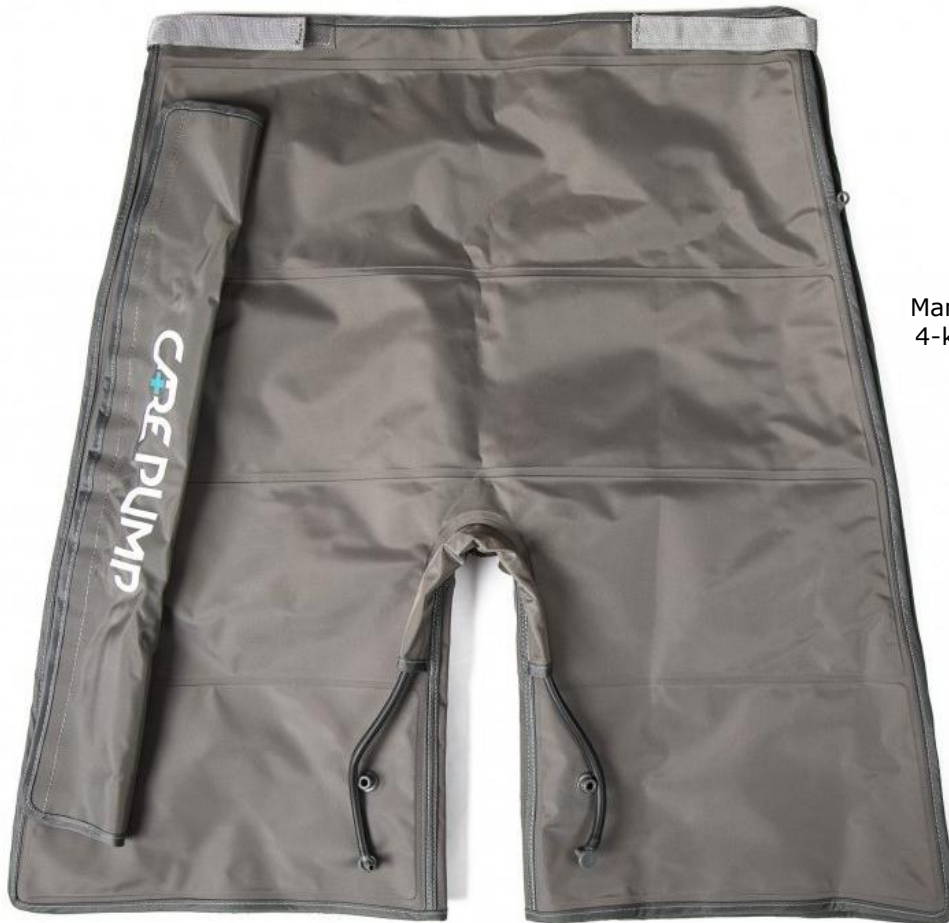
Mankiet krótkie spodnie 4-komorowy