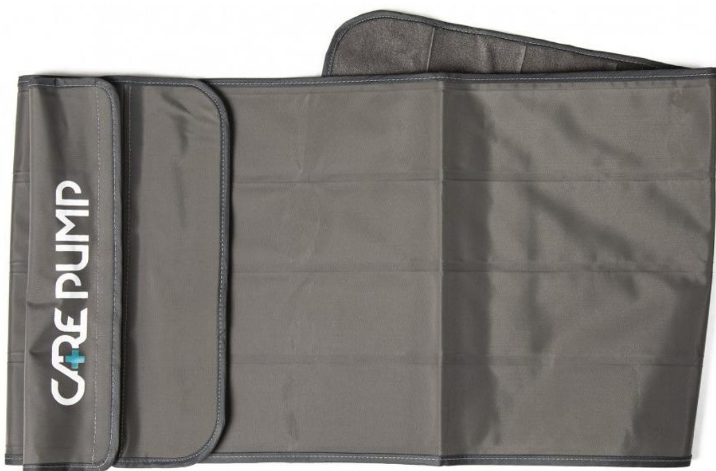
Mankiet pas na biodra i brzuch 4-komorowy