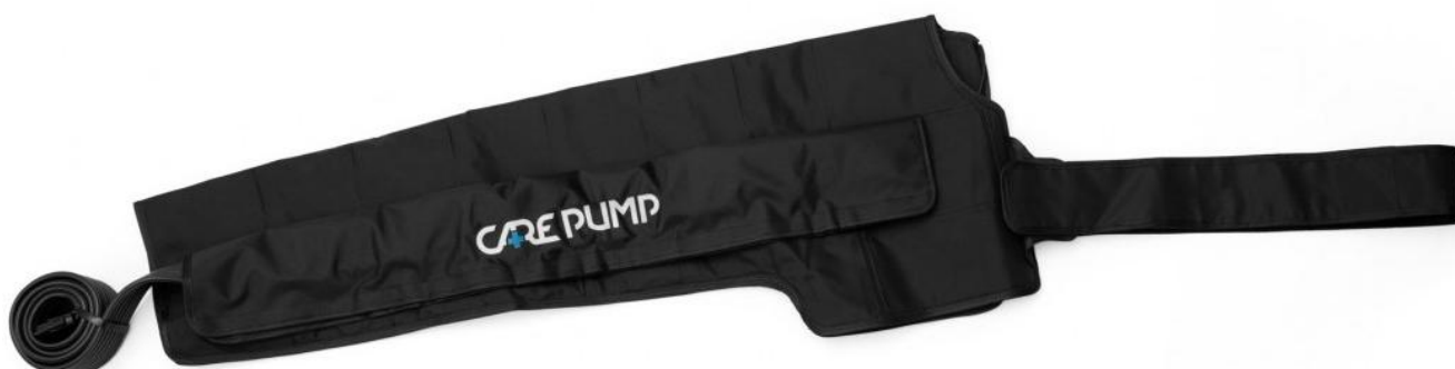
Mankiet na prawą rękę, bark i pierś, 8-komorowy