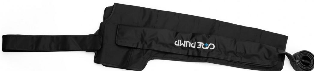
Mankiet na lewą rękę, bark i pierś 8-komorowy