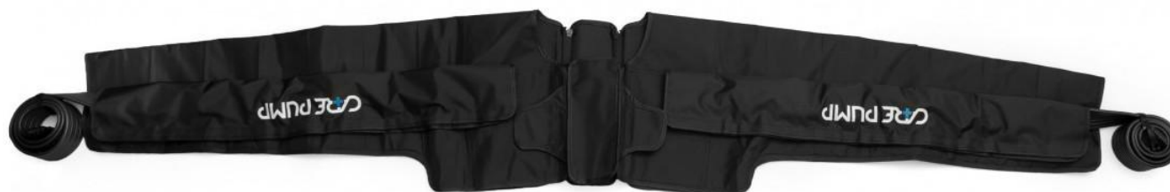
Mankiet podwójny na ręce, barki i klatkę piersiową 8-komorowy