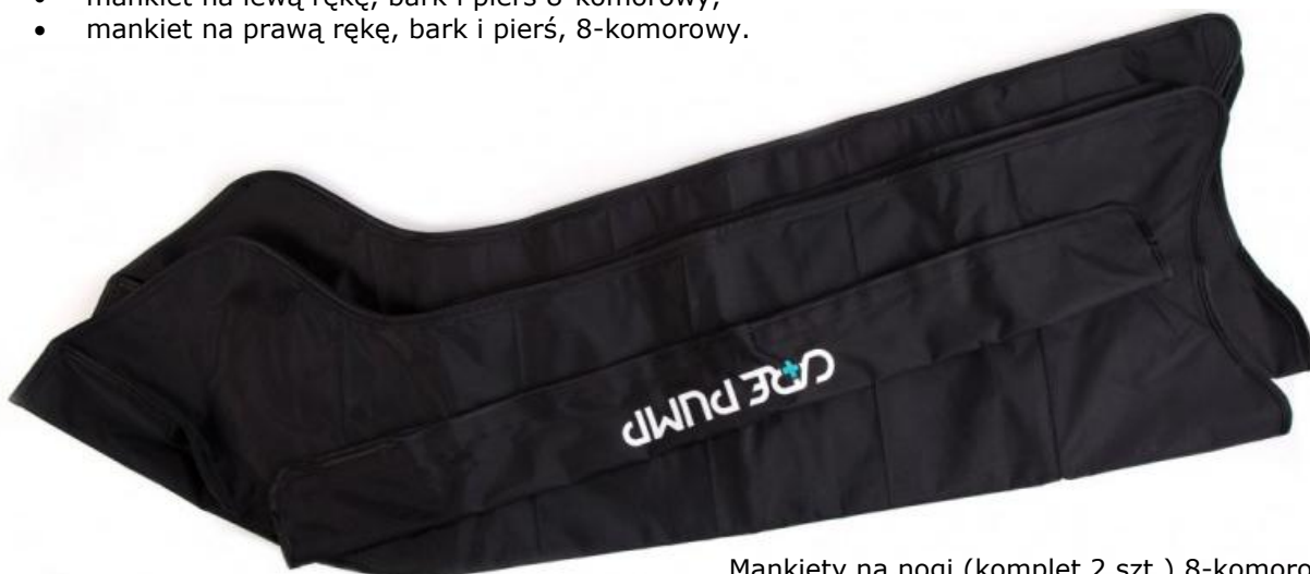
Mankiety na nogi (komplet 2 szt.) 8-komorowe