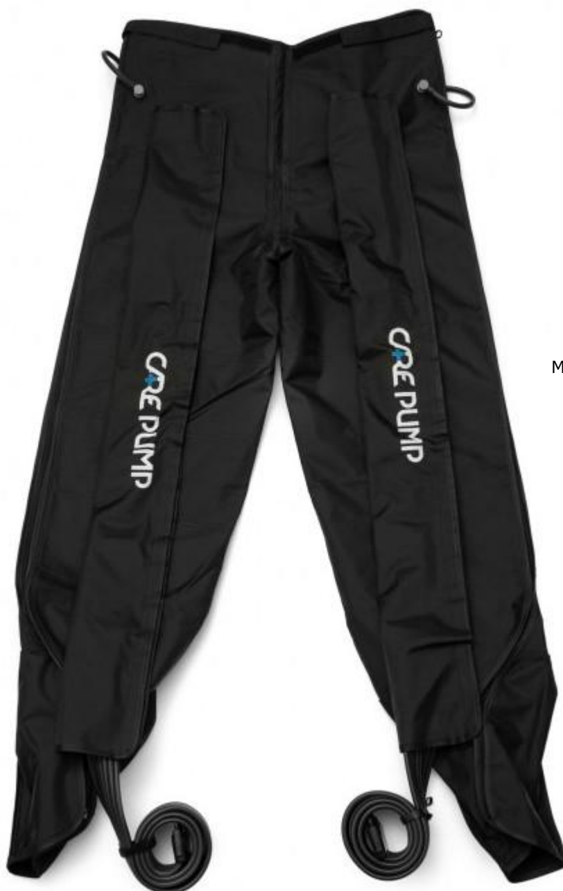
Mankiet długie spodnie 8-komorowy