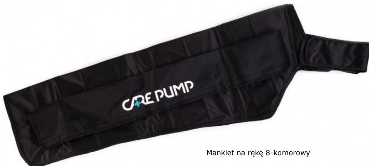
Mankiet na rękę 8-komorowy