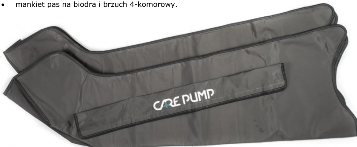
Mankiety na nogi (komplet 2 szt.) 4-komorowe