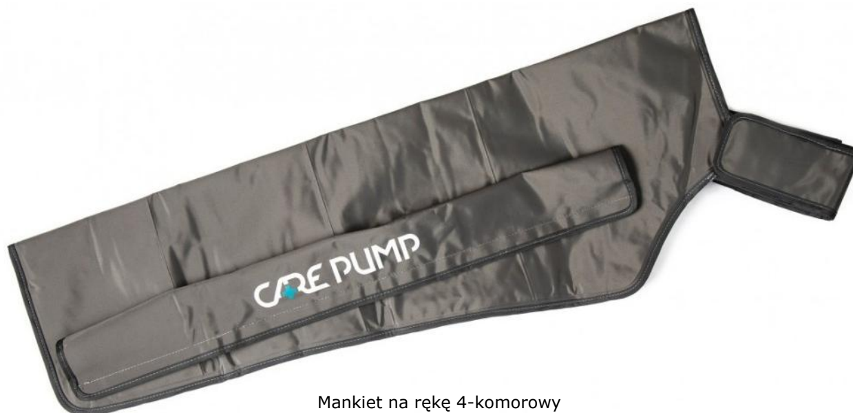
Mankiet na rękę 4-komorowy