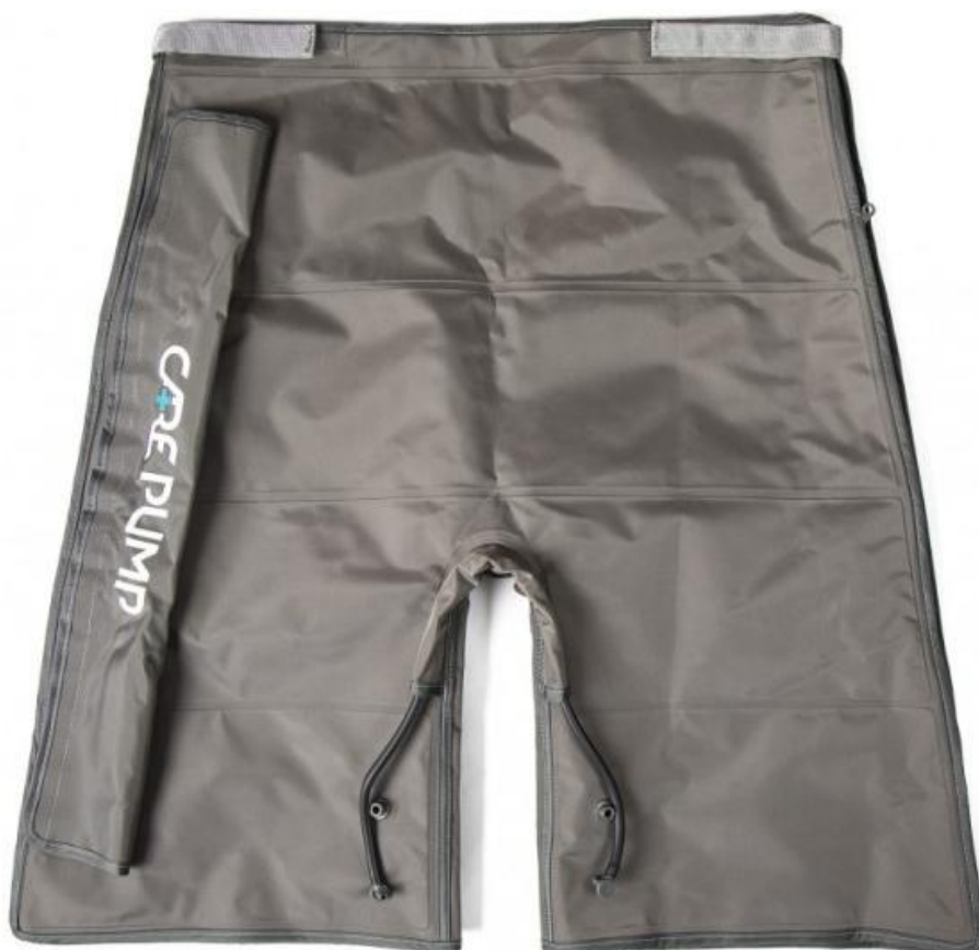
Mankiet krótkie spodnie 4-komorowy