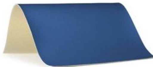
12 - granatowy