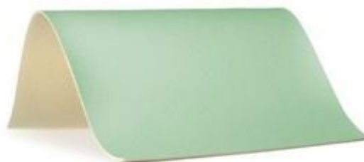
22 - zielony