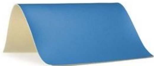
23 - niebieski