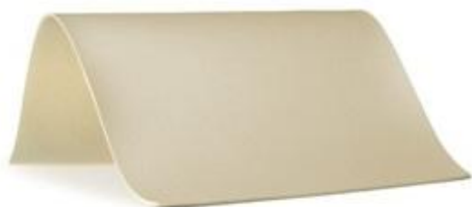
33 - beżowy