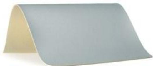
29 - szary