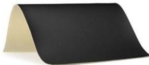
15 - czarny