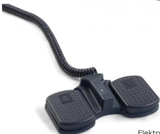
Elektryczna regulacja wysokości za pomocą sterownika nożnego