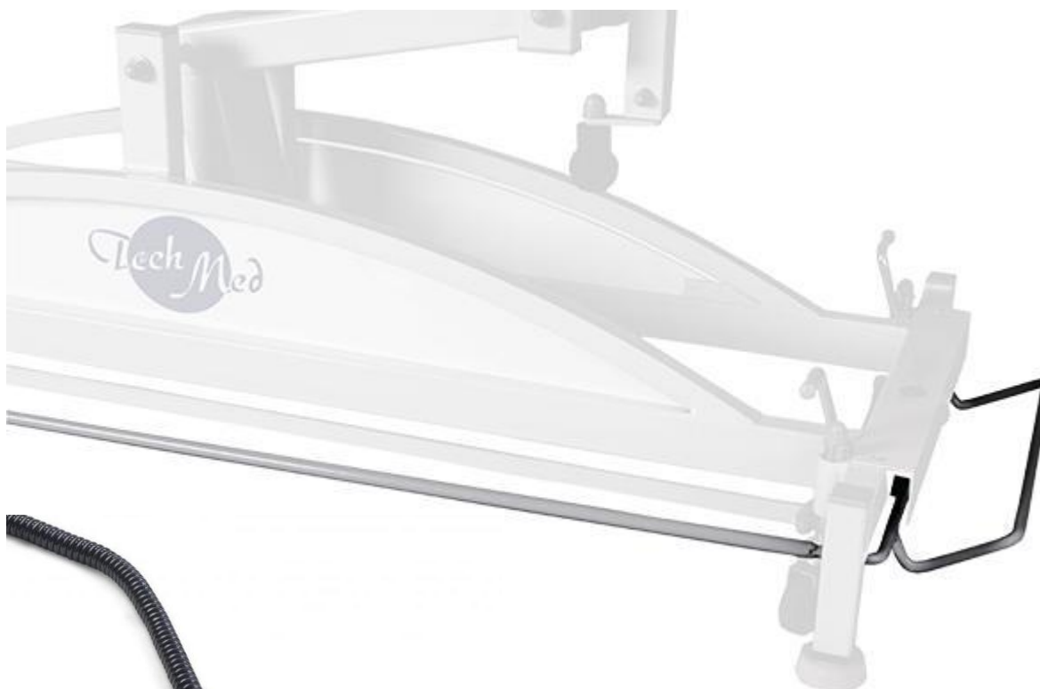
Elektryczna regulacja wysokości za pomocą ramy sterującej