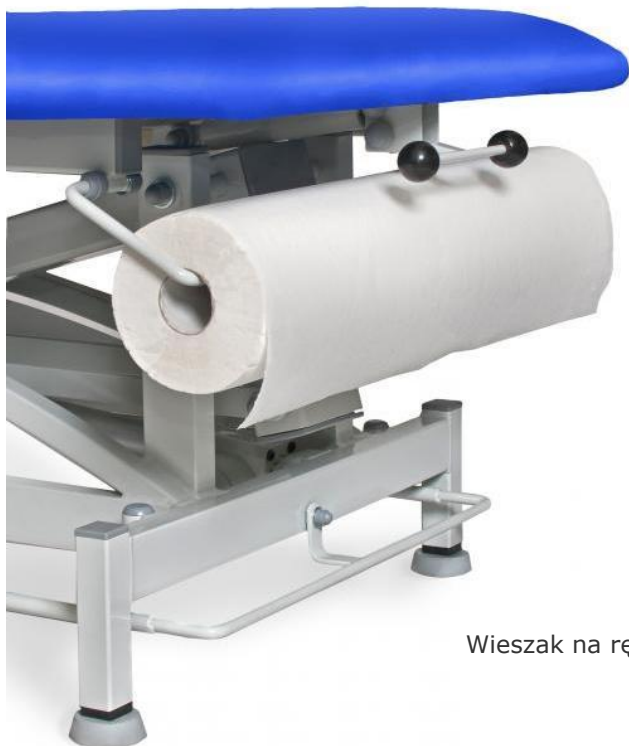
Wieszak na ręczniki papierowe