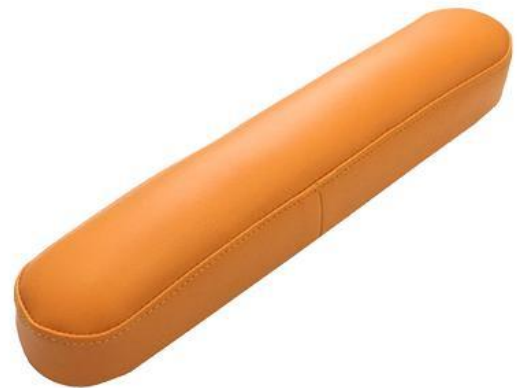
Zatyczka do dodatkowego otworu w leżysku