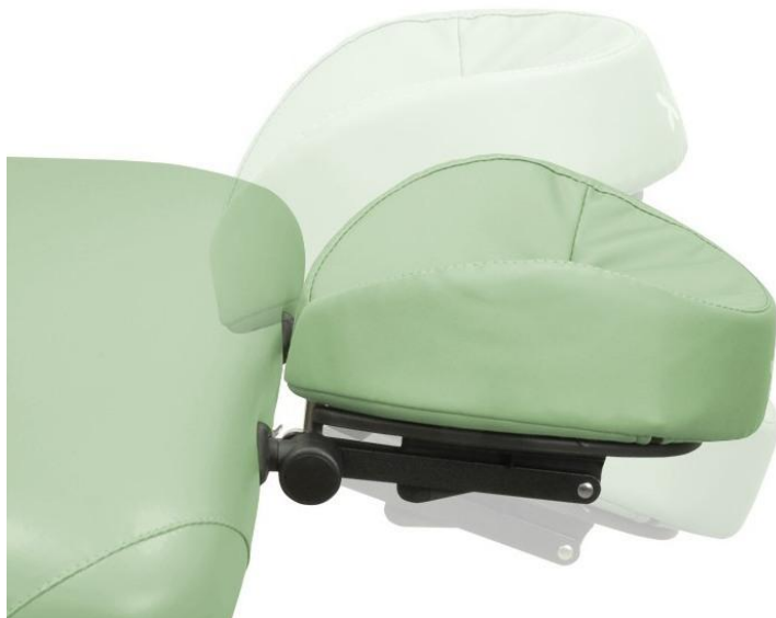
Podglówek regulowany 2D Ergo