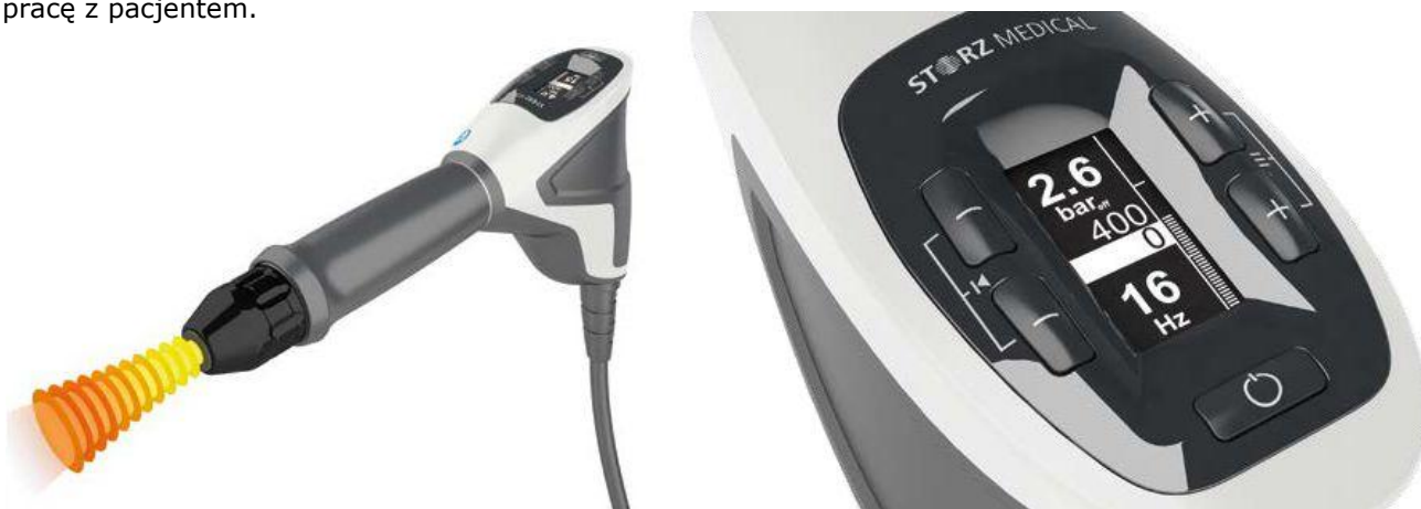
Wszystkie elementy sterujące zintegrowane z wyświetlaczem głowicy Active-tip-control

elementy obsługi zostały zintegrowane z wyświetlaczem głowicy. Parametry leczenia, takie jak ciśnienie, częstotliwość, nacisk kontaktowy i liczba uderzeń, można jednoznacznie wprowadzić lub wywołać na panelu sterowania wyświetlacza głowicy, dzięki czemu osoba obsługująca znajduje się cały czas przy pacjencie, choć samo urządzenie zajmuje miejsce z tyłu. Dodatkowo głowica FALCON oferuje wyjątkowy walor: niezawodne ustawienia wstępne (IPS-Control - Indywidualne Ustawienia Parametrów) dla wszystkich wskazań ESWT zawierające parametry leczenia zalecane przez doświadczonych użytkowników, co znacznie ułatwia pracę z pacjentem.