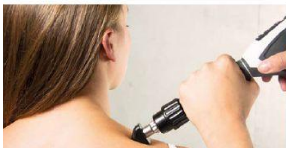
Powięź barku i szyi