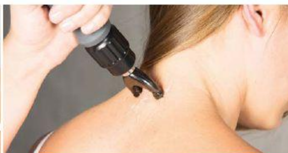
Mięśnie kręgosłupa szyjnego