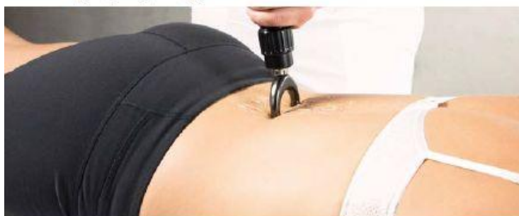
Mięśnie kręgosłupa lędźwiowego