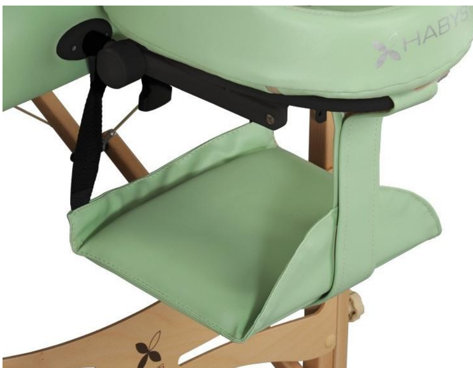
Półka przednia pod ramiona Simply