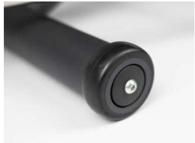
Wytrzymałe gumowe kółka