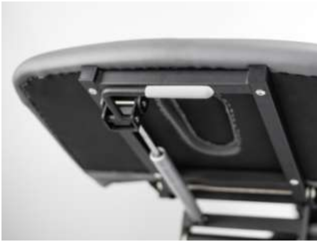
Zagłówek regulowany sprężyną gazową