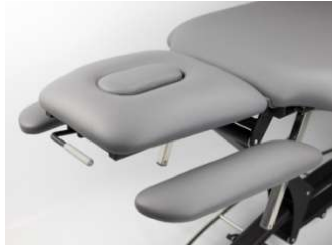
Podłokietniki z innowacyjną, płynną regulacją