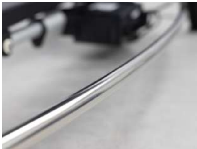
Rama sterująca do regulacji wysokości