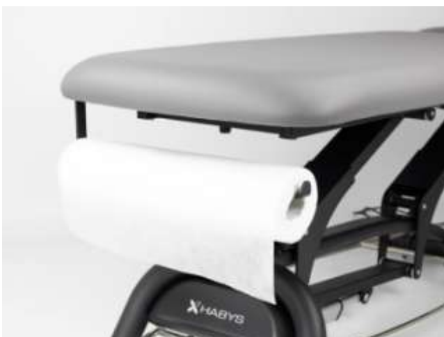
Wieszak na podkład jednorazowy w rolce