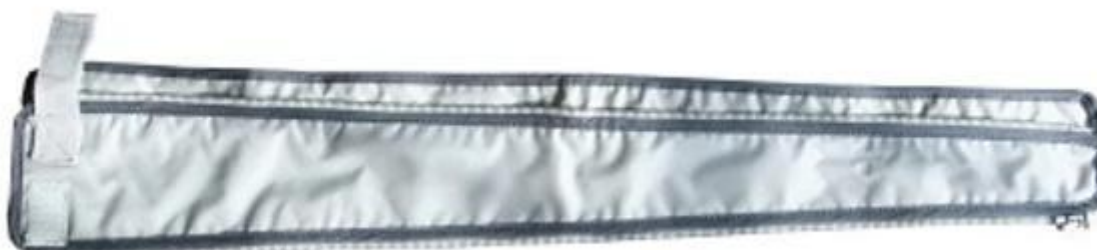
Pas rozszerzający mankiet na rękę i nogę