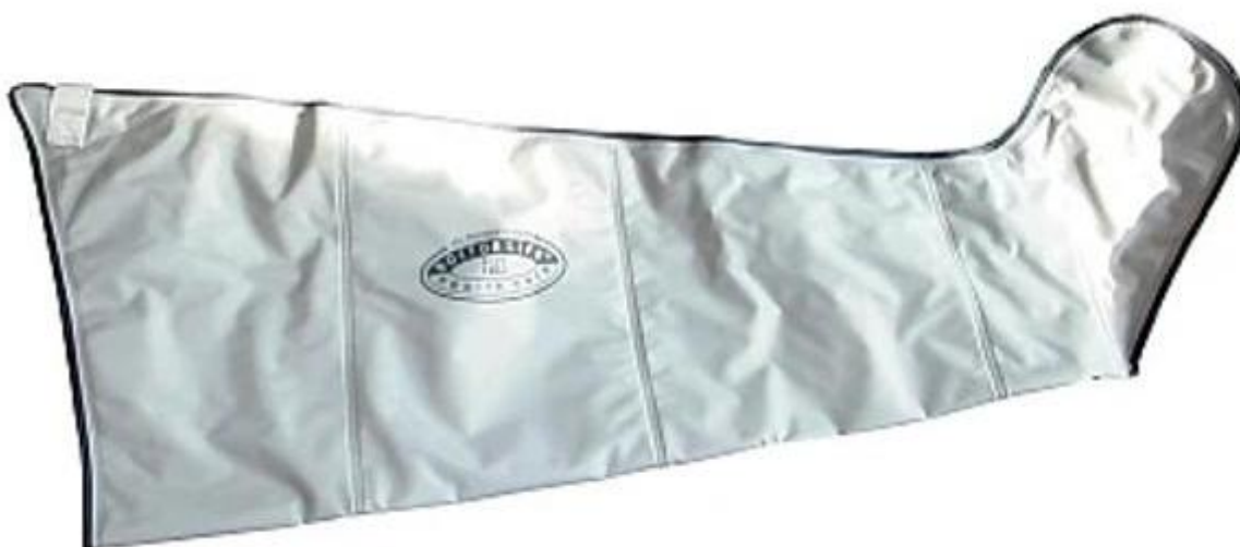
Mankiet 4 komorowy na nogę rozmiar XL