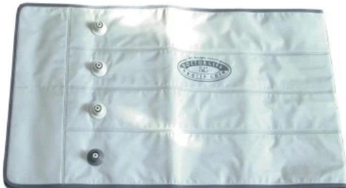
Mankiet 4 komorowy na pas biodrowy rozmiar XL