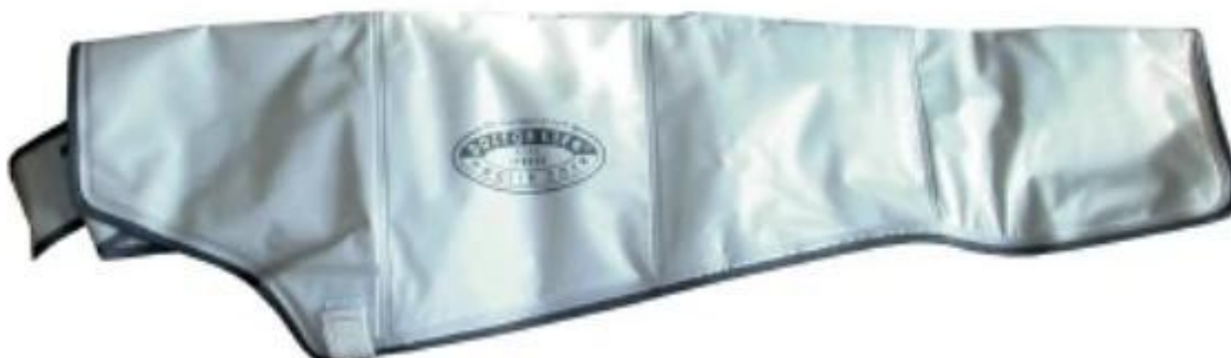
Mankiet 4 komorowy na rękę