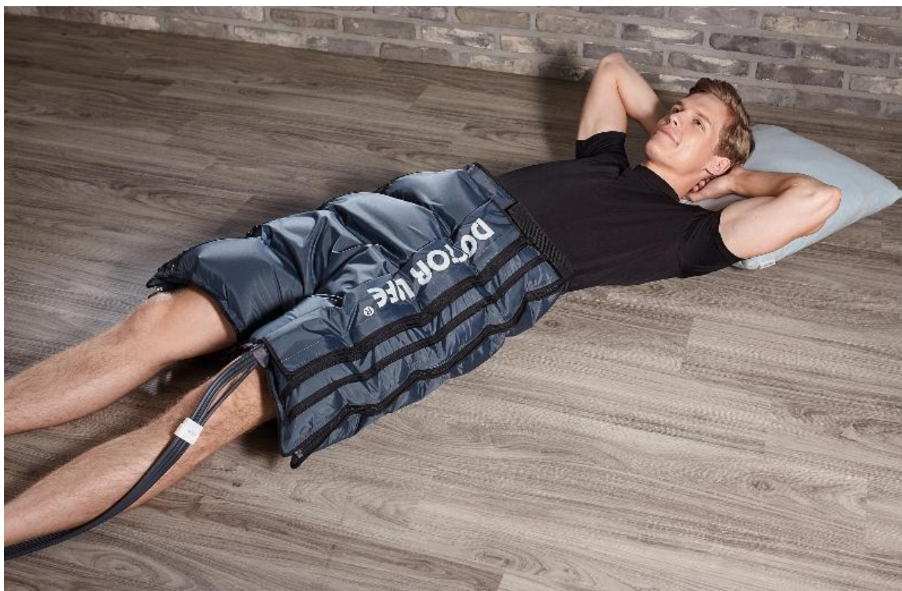
Mankiet 4 komorowy spodenki