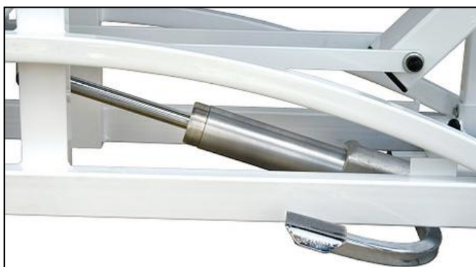
Hydrauliczna regulacja wys.