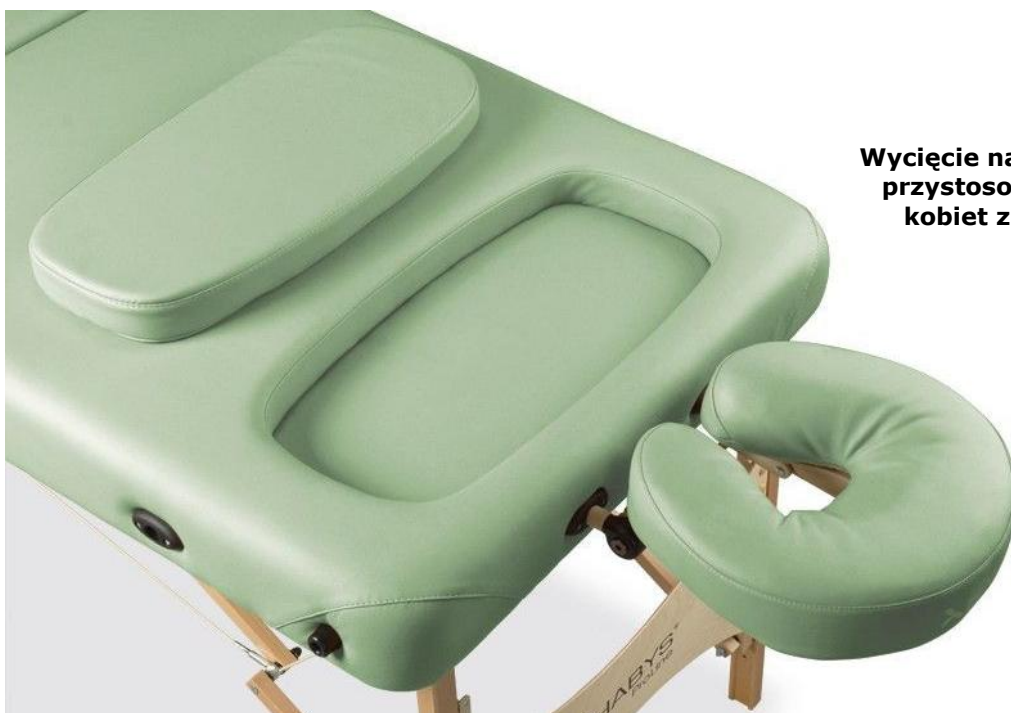
Wycięcie na biust - pozwala przystosować stół do masażu kobiet z dużym biustem