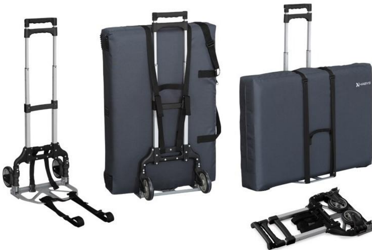
Uniwersalny składany wózek transportowy