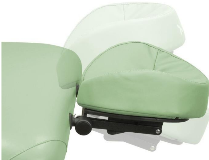
Podglówek regulowany 2D Ergo