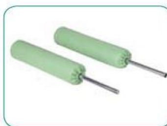
bananki do stabilizacji