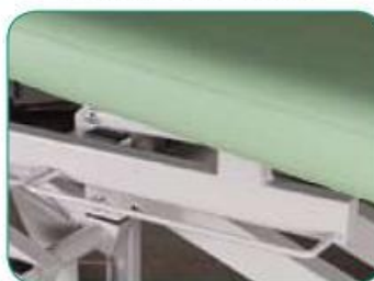
rama do zamocowania pasa