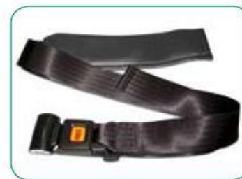
pas do stabilizacji