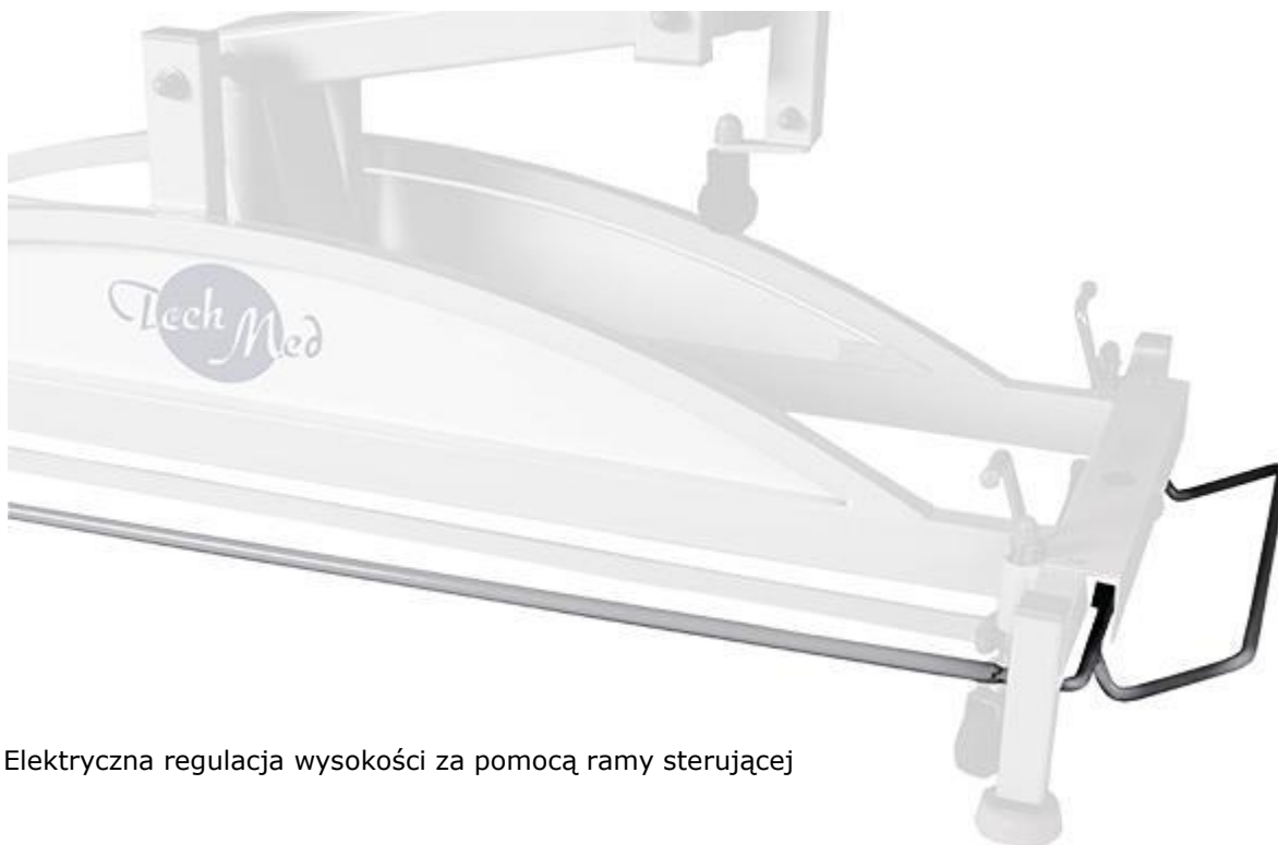
Elektryczna regulacja wysokości za pomocą ramy sterującej