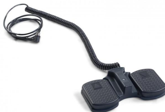
Elektryczna regulacja wysokości za pomocą sterownika nożnego