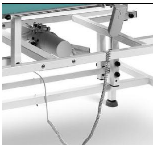
Elektryczna regulacja wys.