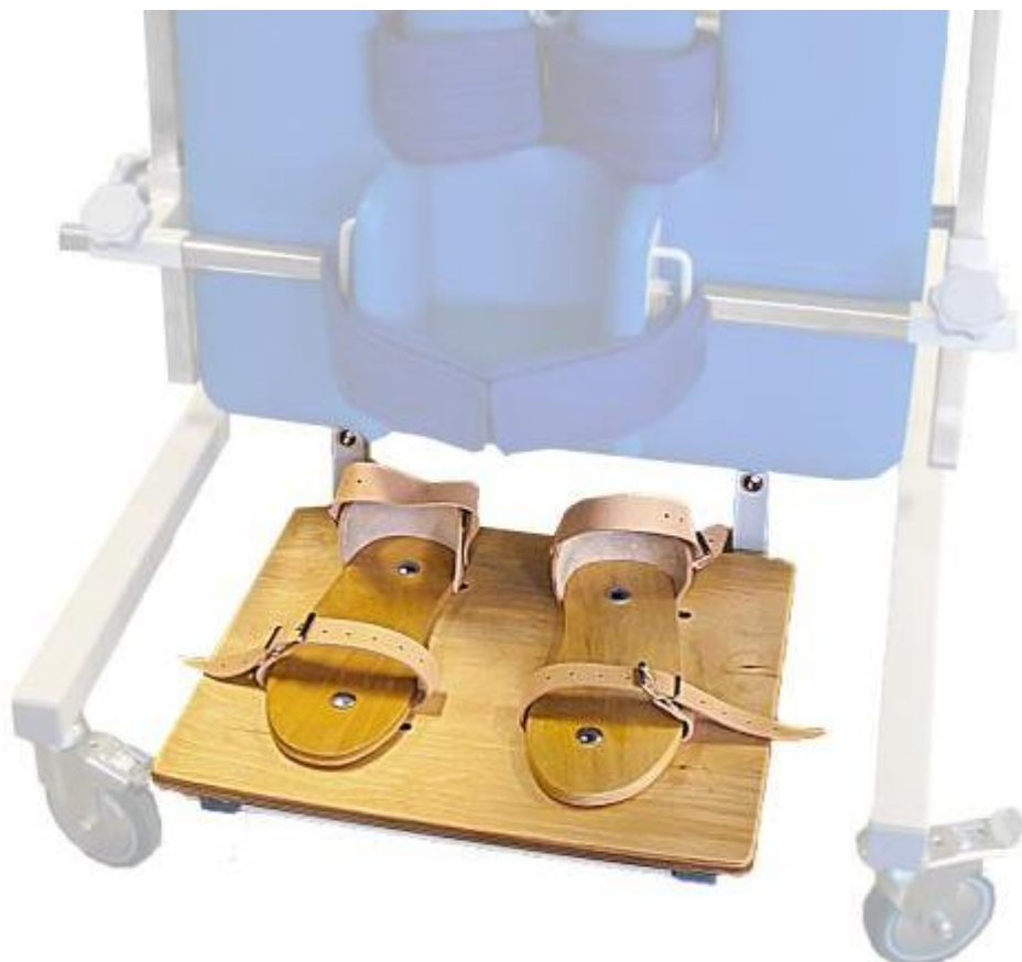
Drewniany podest stabilizujący z sandałami zapinanymi na skórzane pasy