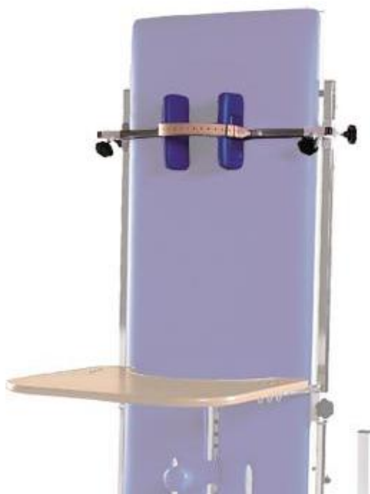
Pufki z paskiem do stabilizacji głowy