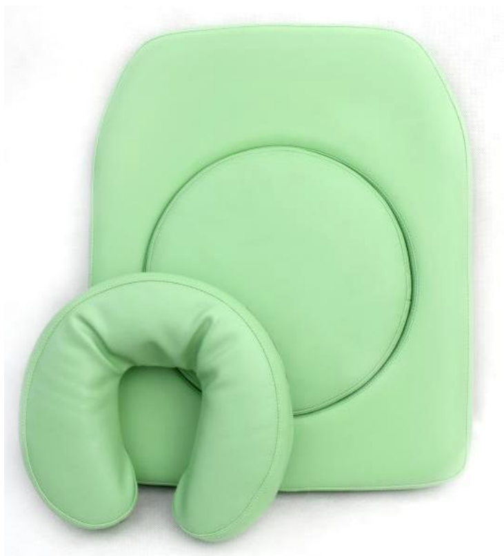
Okrągłe wycięcie w zagłówku z miękką poduszką i zatyczką