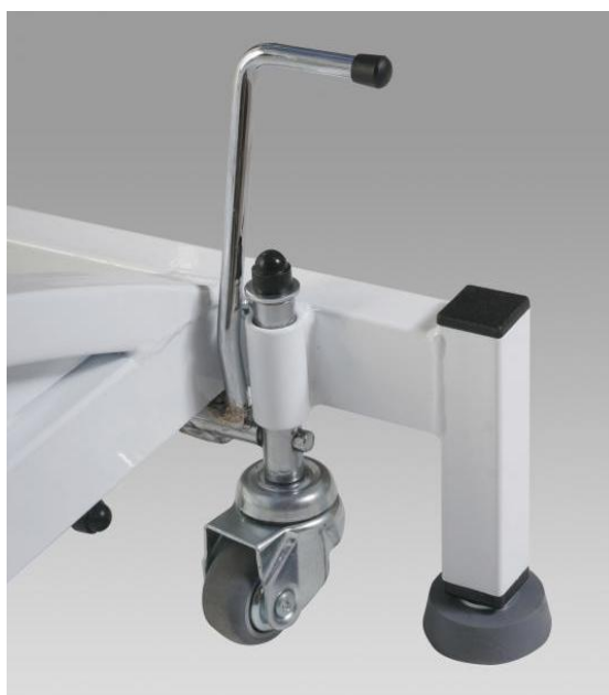
Kółka jezdne z hamulcem centralnym