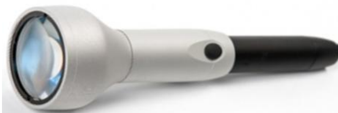
Sonda wysokoenergetyczna HP z zestawem nakładek aplikacyjnych