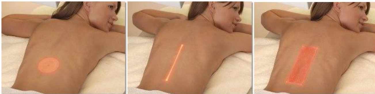
Trzy tryby naświetlania skanerem: elipsa, prostokąt liniowy, krzywe w granicach prostokąta