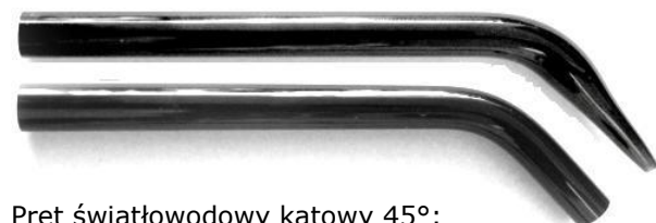
Pręt światłowodowy kątowy 45°: \varnothing 6mm, dł. 8cm; \varnothing 6mm, zwężony do 2mm