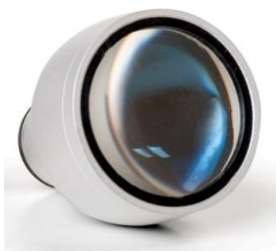
Nakładka skupiająca DILA