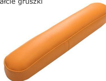
Zatyczka do dodatkowego otworu w leżysku