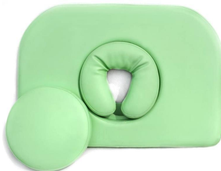
Okrągłe wycięcie w zagłówku z miękką poduszką i zatyczką