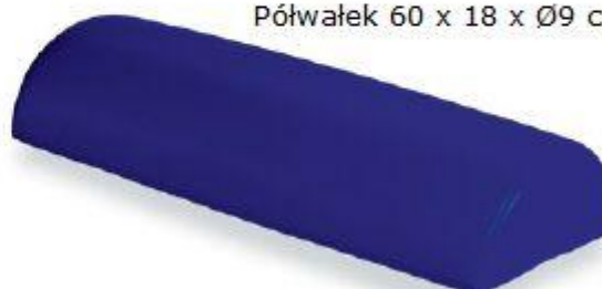
Półwalek 60 x 18 x Ø9 cm