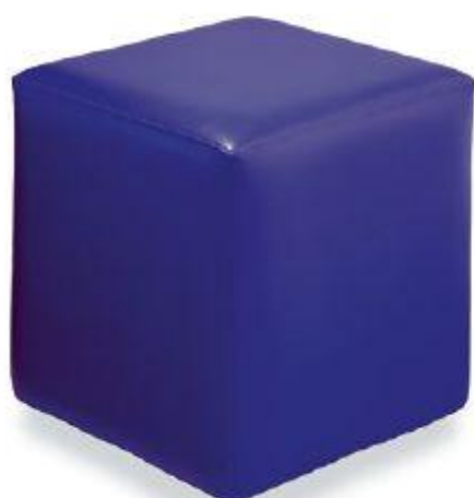
Kostka 45 x 45 x 45 cm