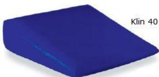
Klin 40 x 40 x 20 cm Klin 40 x 40 x 12 cm