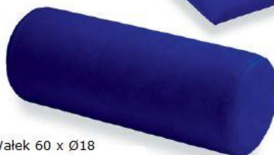
Walek 60 x Ø18