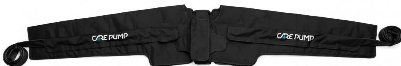
Mankiet podwójny na rękę, barki i klatkę piersiową 6-komorowy