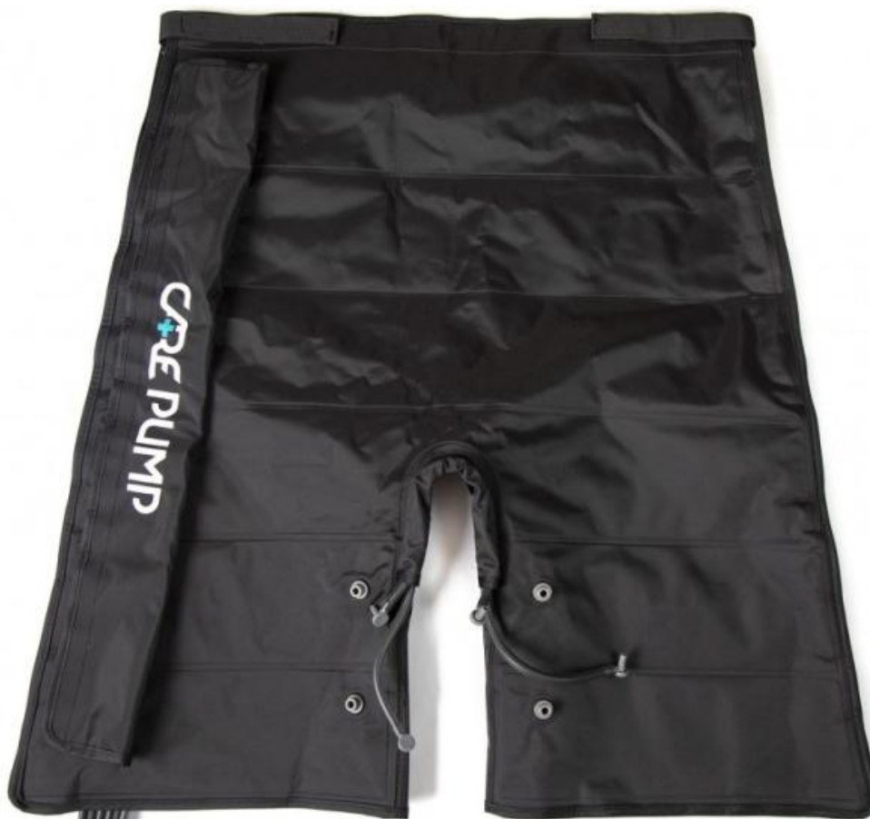
Mankiet krótkie spodnie 6-komorowy