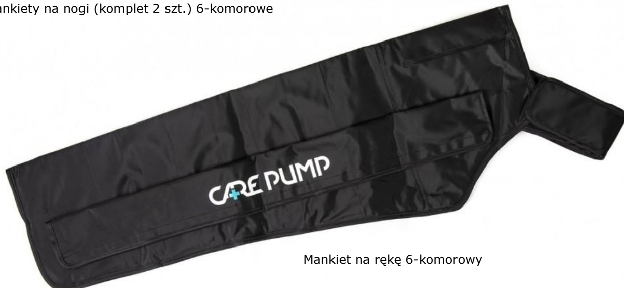
Mankiet na rękę 6-komorowy