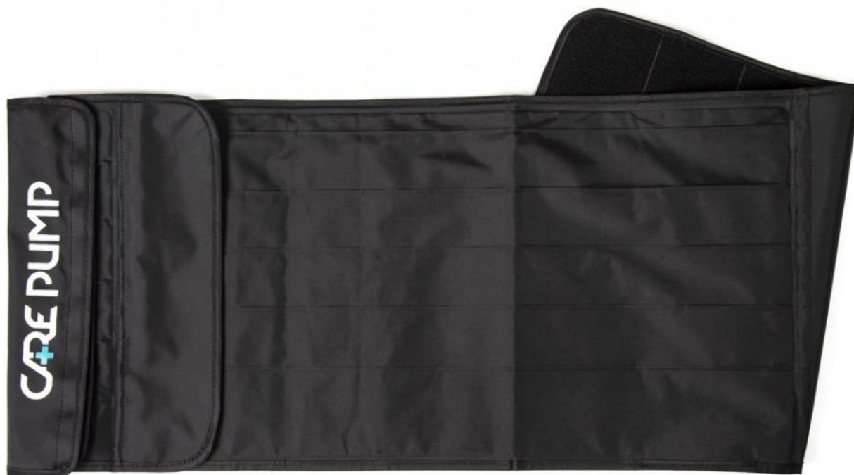
Mankiet pas na biodra i brzuch 6-komorowy