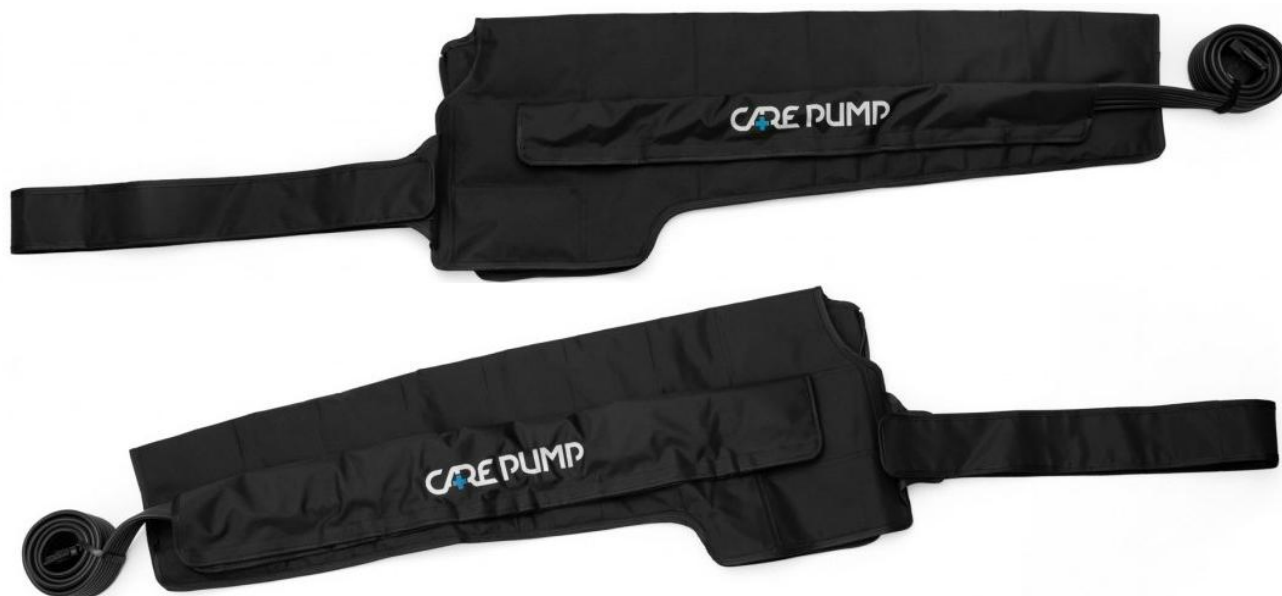
Mankiety na lewą i prawą rękę, bark i pierś 6-komorowe