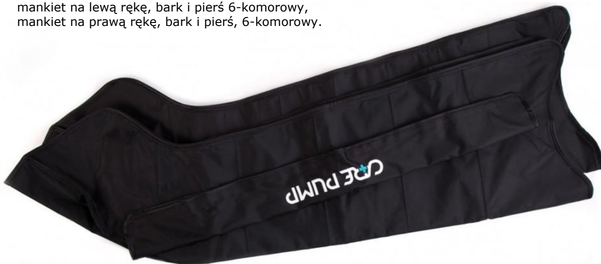
Mankiety na nogi (komplet 2 szt.) 6-komorowe