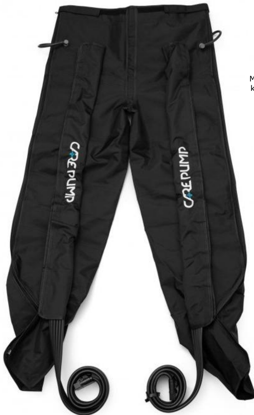
Mankiet długie spodnie 6- komorowy