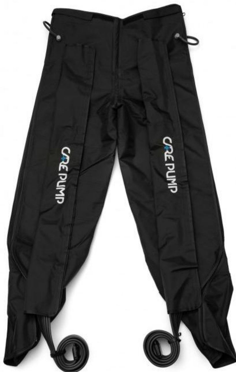
Mankiet długie spodnie 8-komorowy