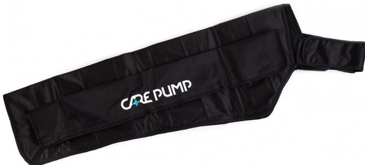
Mankiet na rękę 8-komorowy