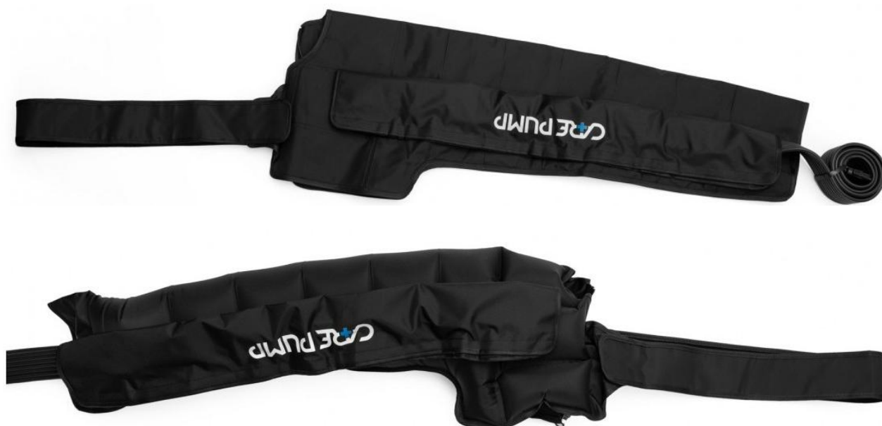
Mankiety na lewą i prawą rękę, bark i pierś 8-komorowe