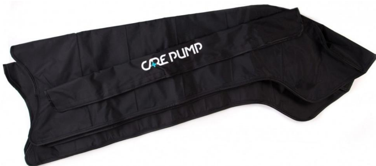
Mankiety na nogi (komplet 2 szt.) 8-komorowe