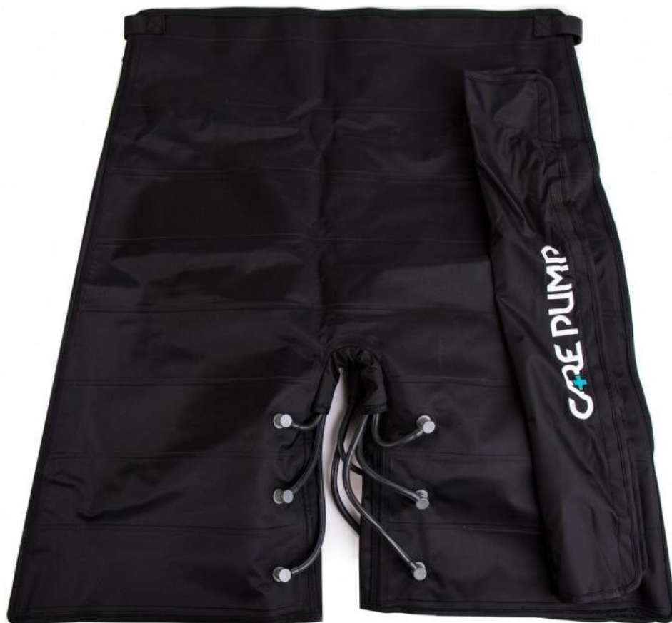
Mankiet krótkie spodnie 8-komorowy