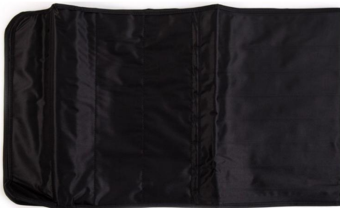
Mankiet pas na biodra i brzuch 8-komorowy