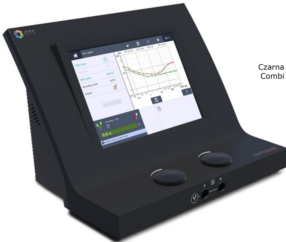
Czarna wersja kolorystyczna aparatu Combi 400