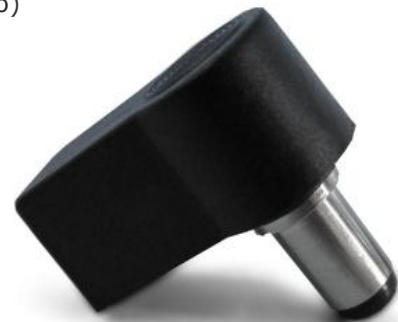
Wtyk blokady drzwi DOOR wykorzystywany w aparatach do laseroterapii: (Polaris 2, rodzina aparatów Etius, PhysioGo)