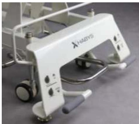
System jezdny wyposażony w 4 skrętne kółka