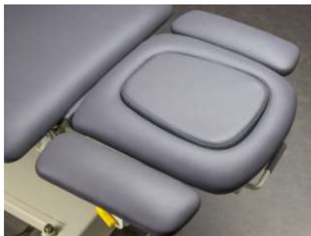
Zatyczka do wycięcia na twarz