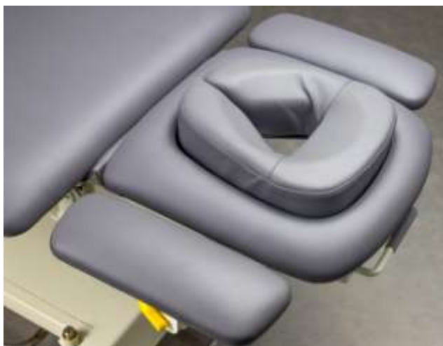
Zagłówek z wycięciem na twarz, poduszką Ergo i dwoma regulowanymi podłokietnikami

Solidna i wytrzymała tapicerka, w dotyku przypominająca naturalną skórę. Wykonana z materiału typu PU. Odporna na zabrudzenia, działanie olejków i środków do dezynfekcji. Kolor tapicerki zachowuje swoją intensywność przez wiele lat. Testowana - spełnia kryteria jakościowe Habys. Kolor tapicerki szary.