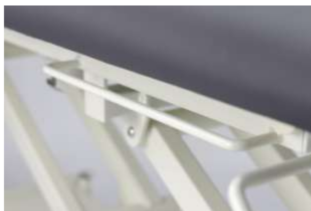
Uniwersalne uchwyty podbłatowe