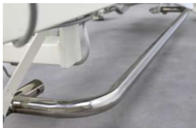
Sterowanie wysokością ramą sterującą