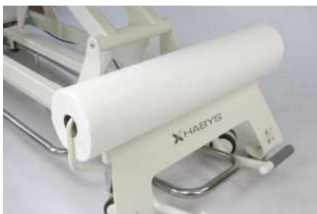
Wieszak na podkład jednorazowy