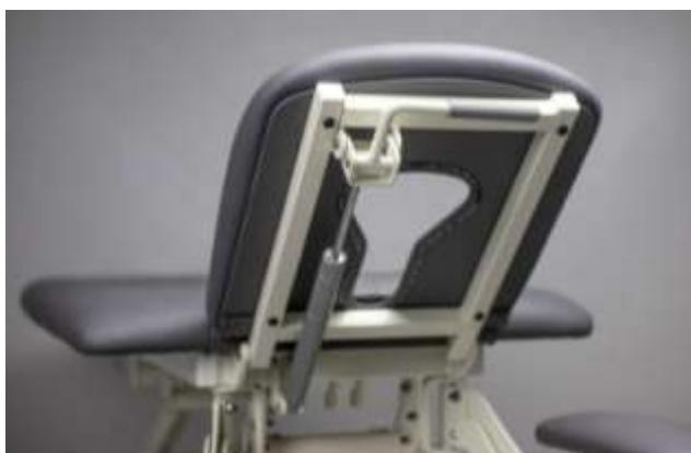
Zagłówek regulowany sprężyną gazową