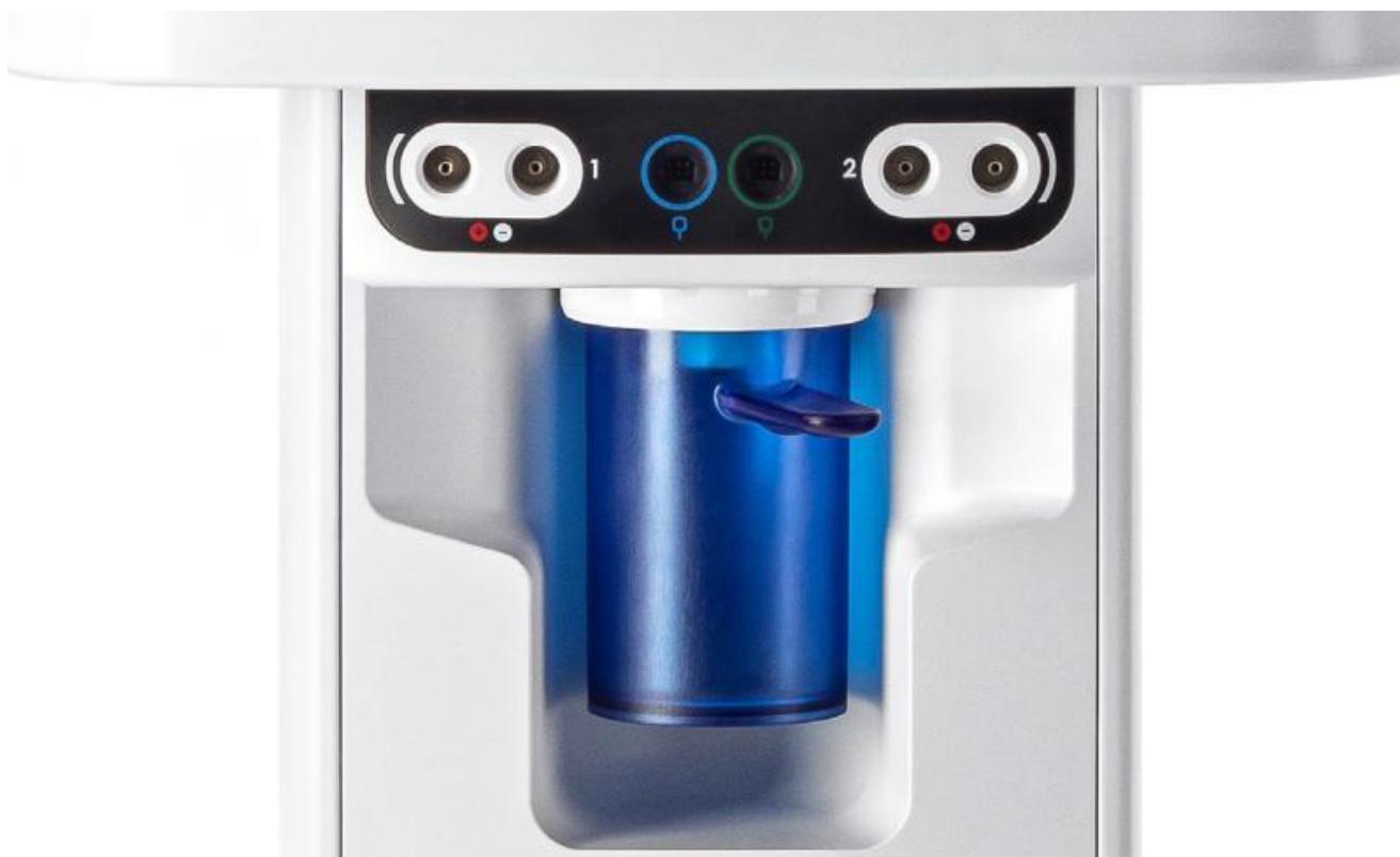
Moduł podciśnieniowy zainstalowany w wózku Intellect Mobile 2 Cart