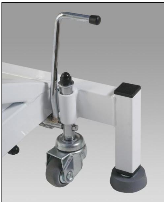
Układ jezdny z hamulcem centralnym