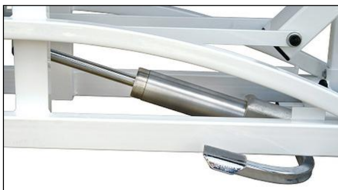
Hydrauliczna regulacja wys.