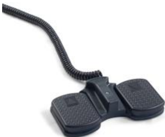
Elektryczna regulacja wysokości za pomocą sterownika nożnego