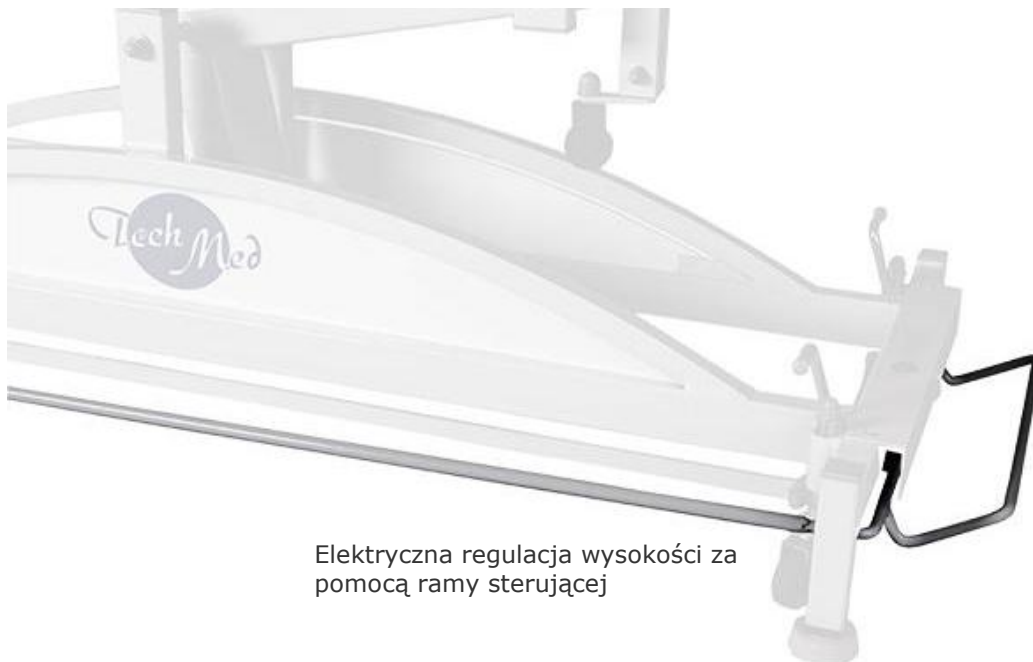
Elektryczna regulacja wysokości za pomocą ramy sterującej