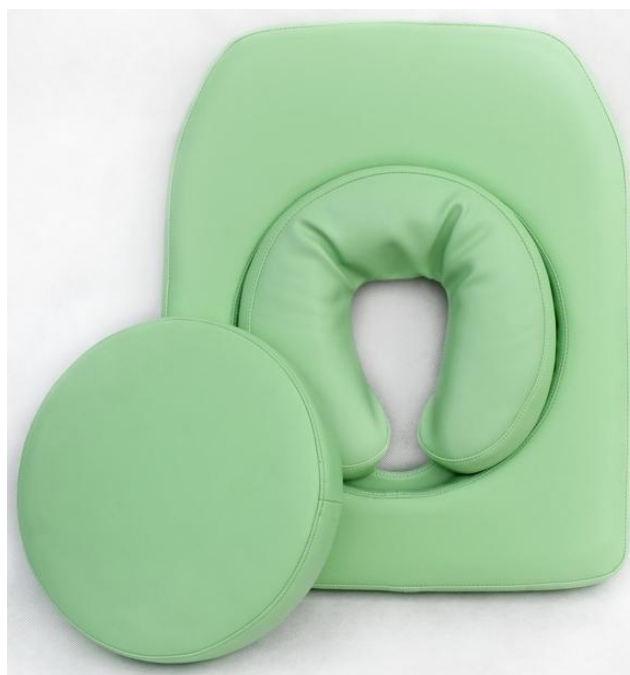
Układ jezdny z hamulcem centralnym