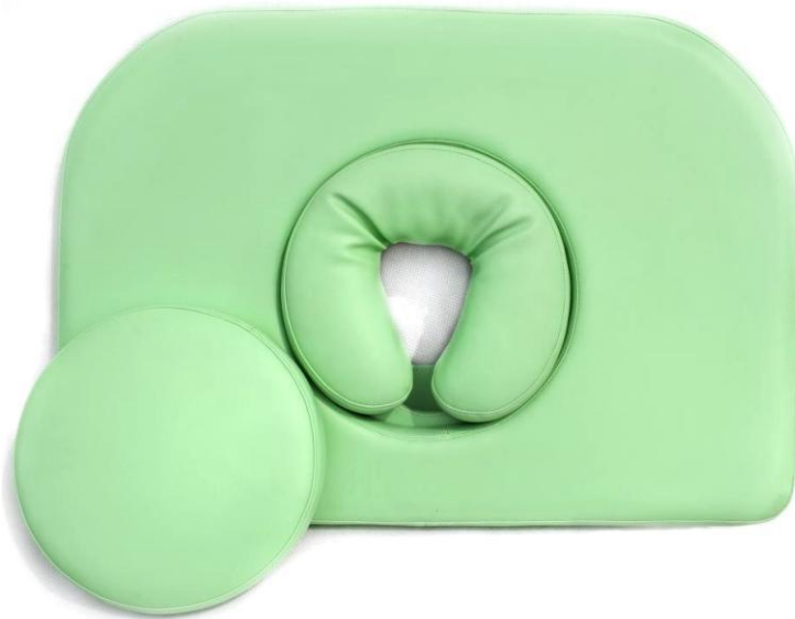
Okrągłe wycięcie w zagłówku z miękką poduszką i zatyczką