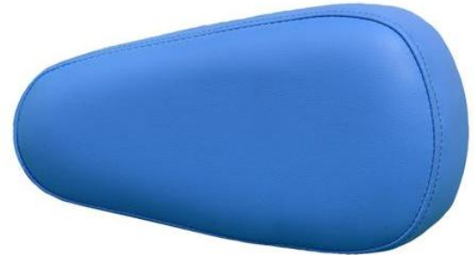
Zatyczka do standardowego otworu w zagłówku w kształcie gruszki