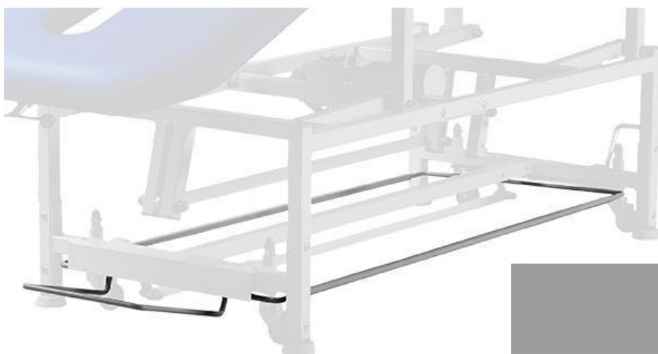
Elektryczna regulacja wysokości za pomocą ramy sterującej