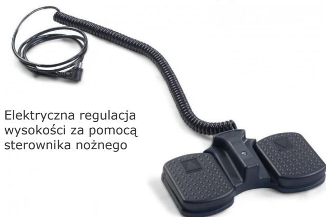
Elektryczna regulacja wysokości za pomocą sterownika nożnego