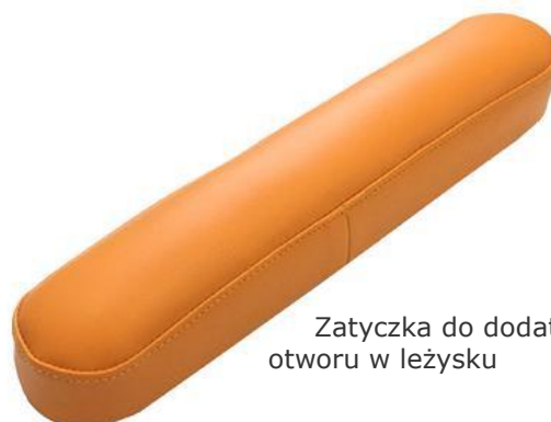
Zatyczka do dodatkowego otworu w leżysku