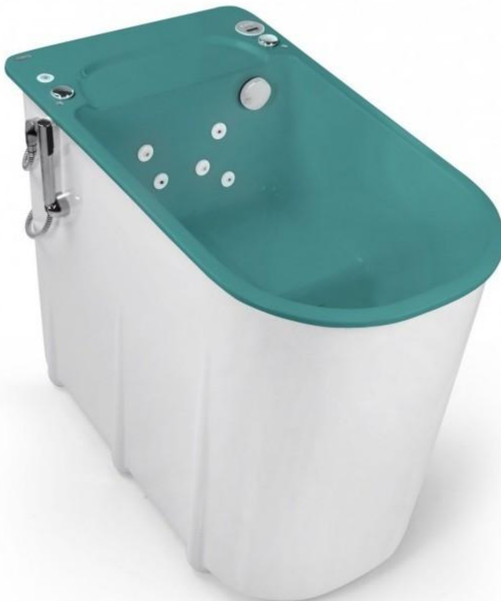
Niecka urządzenia w kolorze calypso

Na życzenie klienta istnieje możliwość wykonania niecki w innych kolorach (termin oraz koszt do indywidualnego ustalenia).